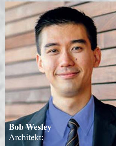
Bob Wesley Architekt:

Antik bis modern. Verkauf, Eintausch. Reinigung, Restauration. Heimservice. Seriöse, individuelle Expertise. Kein Bluff und Fake. Verlässlich und kulant. jea